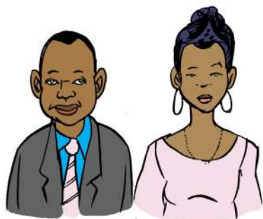
NDOA YA KIKRISTO