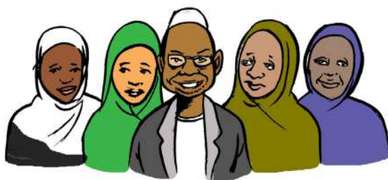
NDOA YA KIISLAMU YA WAKE WENGI