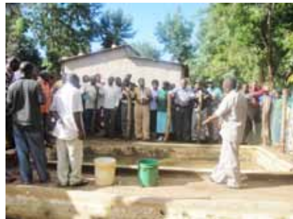
Baraza la Madiwani la Halmashauri ya Kongwa lilipotembelea wabunifu kijijini Chamkoroma

katika ngazi zote na kuwa wa t h a m a n i katika maendeleo ya kilimo. Hata hivyo, kama mafanikio ya taratibu za mradi wa LISF, yakitumika pamoja na yale ya utafiti rasmi yatatoa mbinu bora zaidi amabazo zitakubalika kwa haraka kuleta mabadiliko katika namna bora ya kuendeleza kilimo.