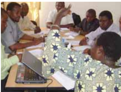
Wajumbe wa Kamati ya Utekelezaji ya Kanda wakipitia maombi ya wabunifu

muhimu kilichozingatiwa kushauri maboresho na/au kutoa ufadhili kwa baadhi ya bunifu. Hatua ya nne ilikuwa kuwasilisha maombi yaliyoboreshwa au kurekebisha kwenye kikao cha kamati ya kanda ya wadau wa LISF, kwa idhinisho kama zimezingatia kikamilifu vigezo muhimu vya LISF. Hatua ya tano ni kuwapa taarifa wabunifu ambao maombi yao yamekubalika kwa ufadhili wa majaribio ya pamoja. Wabunifu waliingia mikataba na Mashirika waratibu ili waingiziwe fedha kwenye akaunti zao za benki. Mikutano ya kanda ilihudhuriwa pia na Mratibu wa PELUM Tanzania pamoja na Afisa Mradi wa PROLINNOVA.