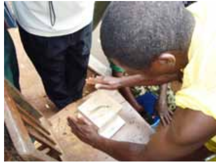
Wakulima wanajukumu kubwa katika ufuatiliaji na tathmini wa tafiti shirikishi

Mwezi Juni 2010, Kamati ya Uendeshaji ya Kitaifa (NSC) ilimteua mtaalam wa ufuatiliaji na tathmini kutoka Taasisi ya Utafiti wa Kilimo-Uyole. Katika ufuatiliaji na tathmini, mipango kazi ya kanda ilikuwa mihimili mikuu muhimu. Washiriki wa ufuatiliaji na tathmini walikuwa wabunifu, wagani na watafiti. Takwimu za aina tofauti zilichukuliwa kutoka kwenye majaribio kwa kutegemeana na aina ya jaribio; takwimu za mavuno, takwimu za ukuaji, takwimu za idadi ya mimea au wanyama kwa mazao ya muda mrefu na mifugo, takwimu za uzito hai kwa mifugo kama samaki, nguruwe n.k. Takwimu hizi ndizo zilitumika kufanya uchambuzi na tafsiri ili kuelewa ufanisi wa bunifu zilizojaribiwa. Kazi ya ufuatiliaji na tathmini kwa sehemu kubwa ilisimamiwa na wabunifu, wagani na mashirika waratibu.