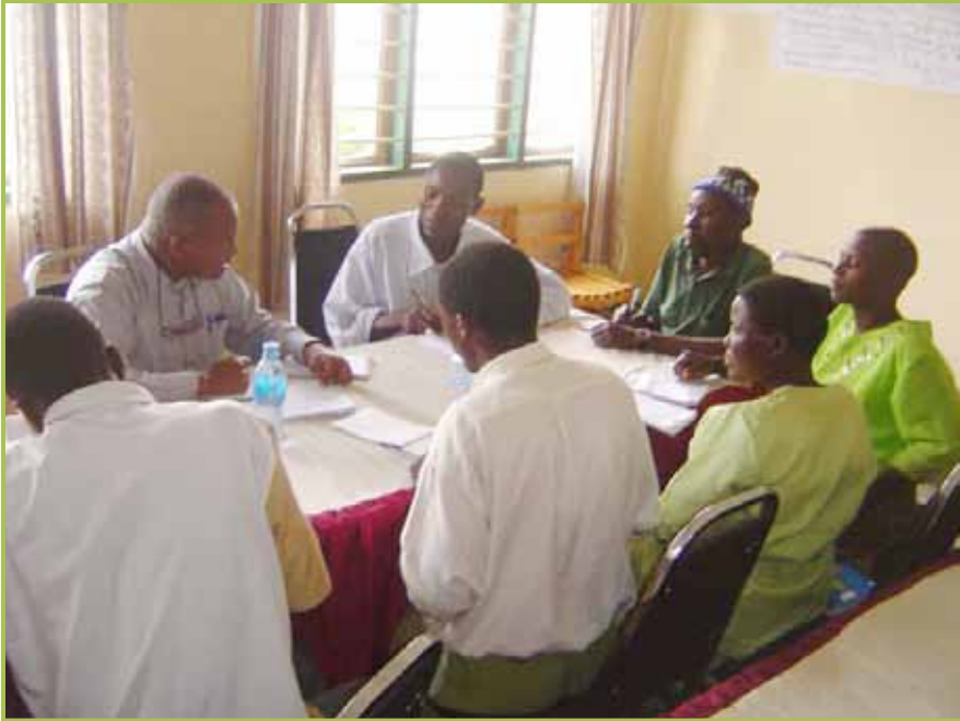
Mtafiti akiwasaidia wabunifu katika kuandaa jaribio la utafiti shirikishi