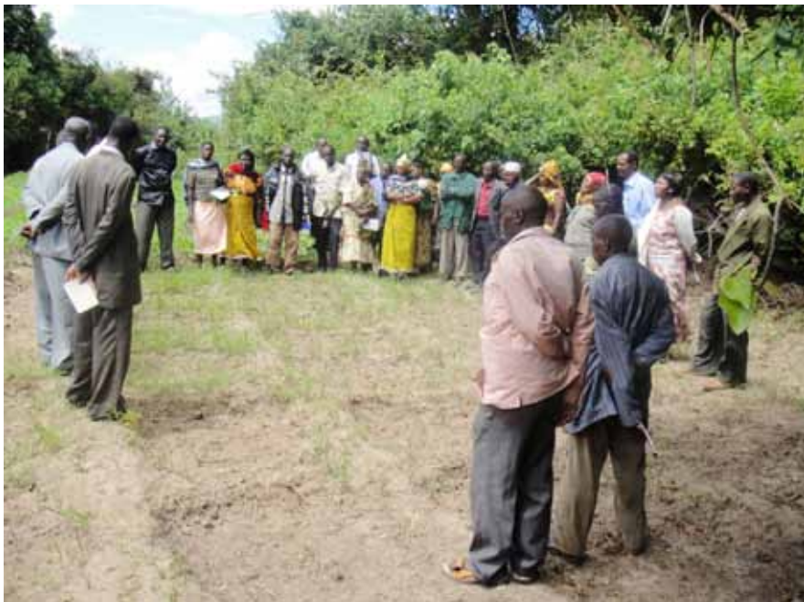
Ziara za mafunzo ni muhinu ili kuwezesha wakulima kujifunza miongoni mwao

katika kaya zinazotumia bunifu hizo. Mazao ya biashara yameongeza pato la kaya na hatimaye kuweza kujinunulia mahitaji mbalimbali na vyakula wanavyohitaji. Bunifu nyingine zimepunguza vifo vya kuku na kupunguza idadi ya miche ya miti inayokauka.